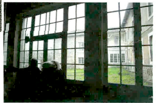
La Maison de retraite, plus en service depuis 2010, était composée notamment d'une Maison de Village datant du 19 e siècle