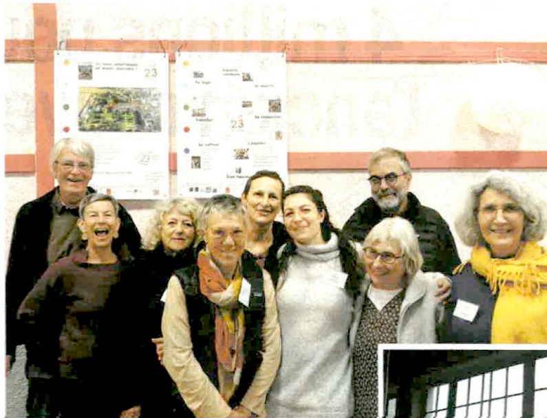
Le 23 vous tente ? Contactez-les au 05.62.98.86.69, ou par mail : contact@23aneres.org

sensibilité des élus locaux pour son projet. Tous les acteurs du territoire son enthousiastes, et les négociations avec le propriétaire, la congrégation franciscaine, s'ensuivent, débouchant sur un accord de principe.